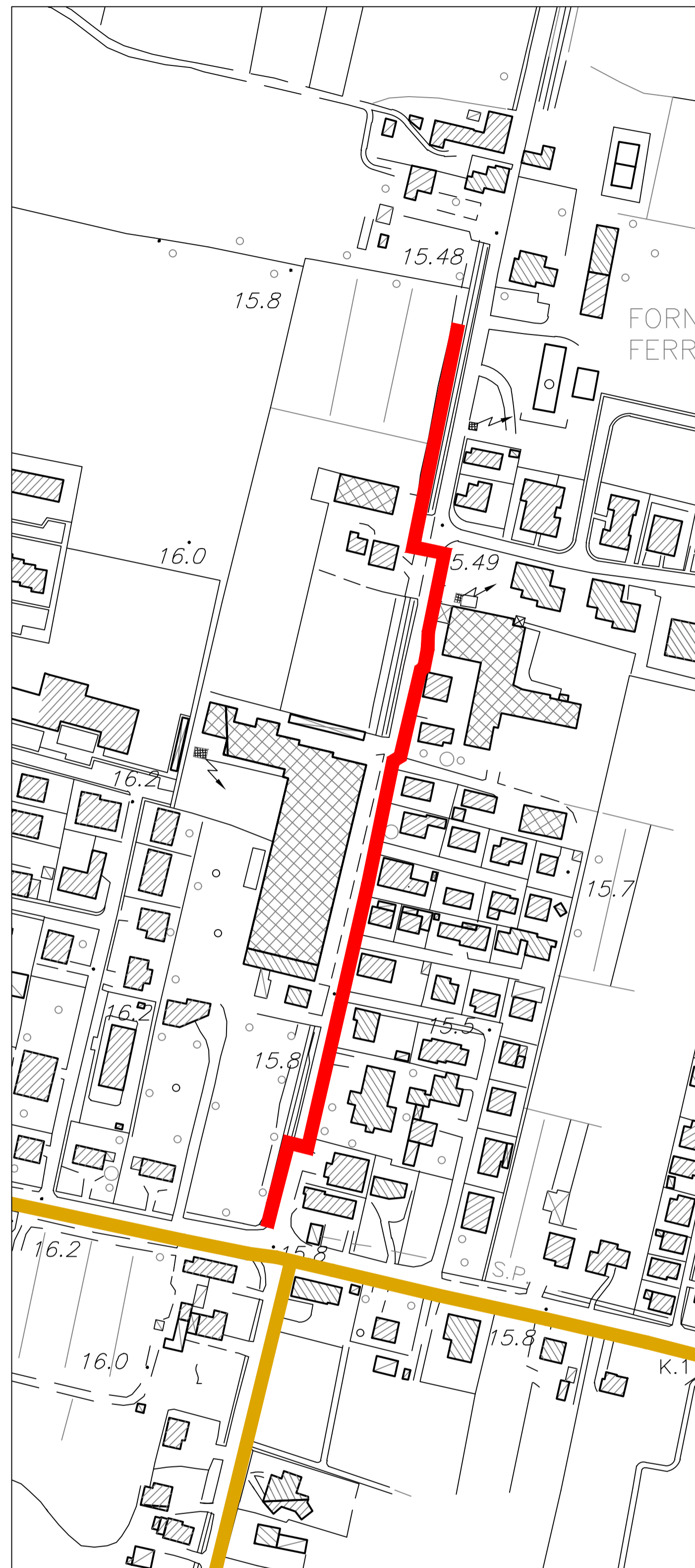
SOVRAPPOSIZIONE SU C.T.R. scala 1:2000