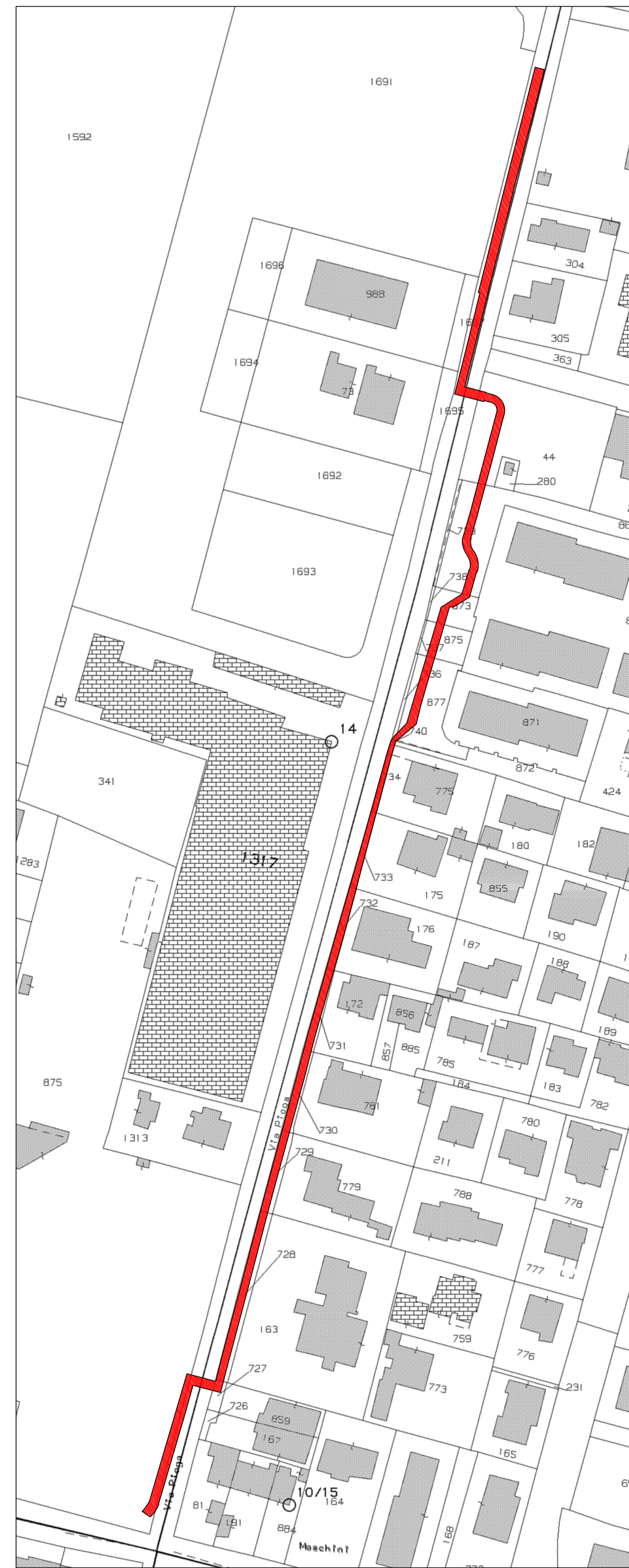
SOVRAPPOSIZIONE CATASTALE scala 1:1000 Comune di Campodarsego Foglio 12 mappale 875; Foglio 15 mappali 727,728,729,730,731,732,733,734,740,877,875,873,869,44