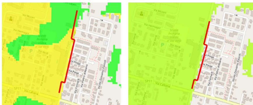
Figura 1 - Estratto PGRA con inserimento tratto di pista ciclabile - Rischio e Pericolosità idraulica