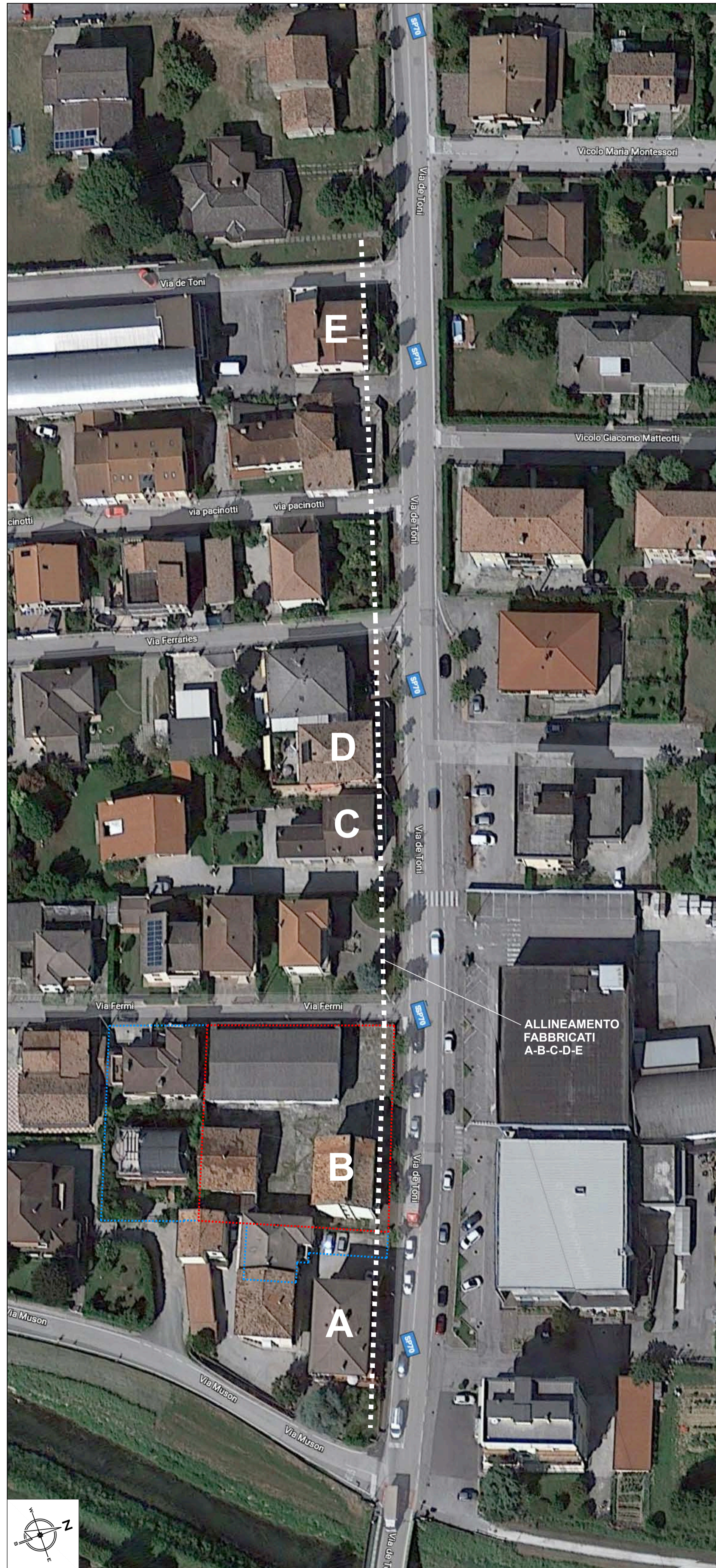
AEROFOTOGRAMMETRICO CON INDIVIDUAZIONE ALLINEAMENTO FABBRICATI VISUALI